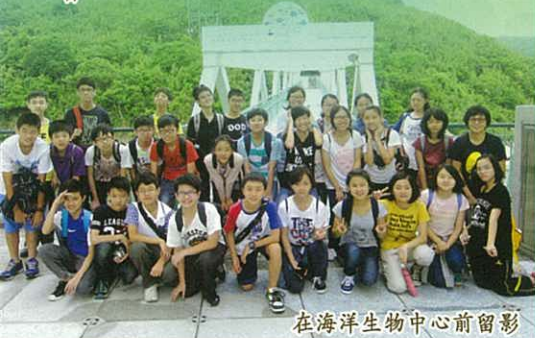
在海洋生物中心前留影