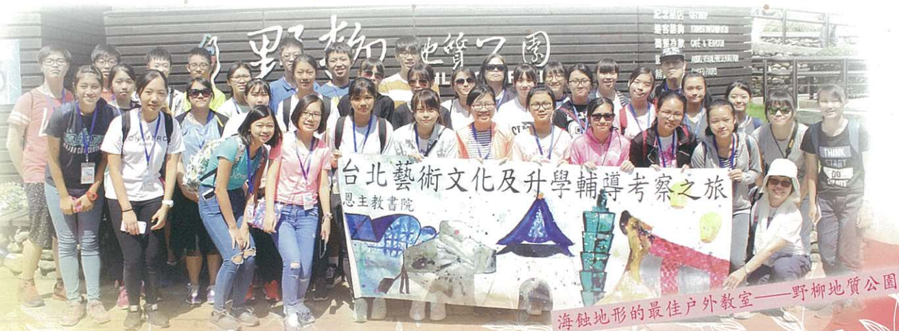
海蝕地形的最佳戶外教室——野柳地質公園

為了擴闊學生的視野，培養學生的世界公民意識，本校德育及公民教育組與升學及就業輔導組合辦「台北藝術文化及升學輔導之旅」，日期由二零一六年九月二十一日至二十五日，前往台北考察交流。行程主要參觀朱銘美術館、樹火紀念紙博物館、三峽染工房、華山1914文化创意產業園區、野柳地質公園，並與國立臺灣大學及淡江大學進行交流。