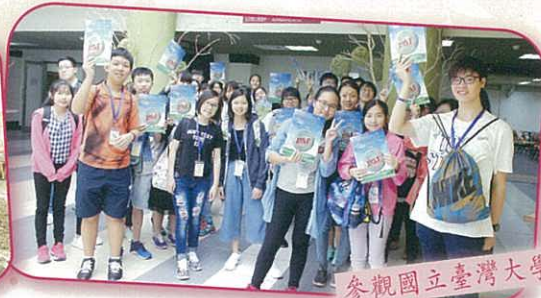
參觀國立臺灣大學