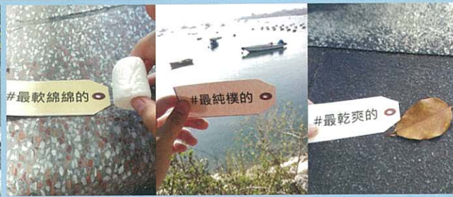
在「#自然標籤」活動中，同學所拍攝的相片