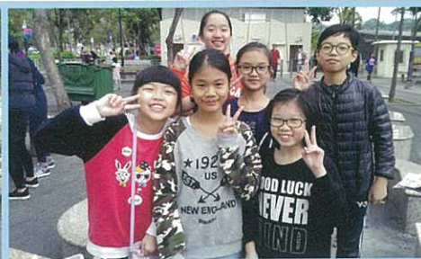
聚會後於大美督碼頭合照留念