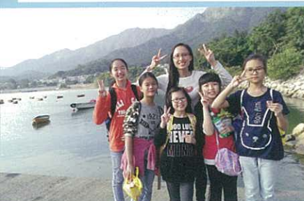
燒烤前，與十二月份出生的成員慶祝生日

從他們拍攝的照片中，顯示出他們認真與投入的一面，而且別具創意。有部分成員更會主動邀請他人拍攝最能表達活動題目的相片，確是勇氣可嘉。同時，這些照片也提醒我們，每人都可為天主創造的自然環境增添美感，但人過多的消耗與物質化的生活，只會使美麗的風景逐漸消逝。